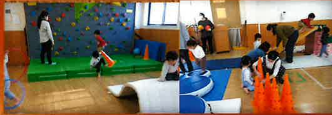
ホールで遊ぼう！の様子です。 広いホールで自由に遊べました！！