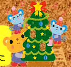
クリスマス 絵本の読み聞かせDay！ みんなでドキドキわくわく とってもステキな時間でした