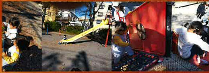
公園で遊ぼうDay 楽しくて寒さも忘れてました